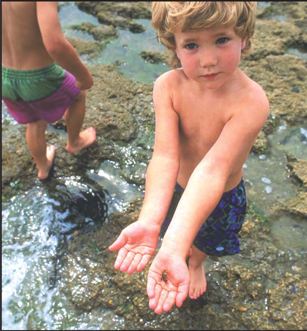
Niños pequeños juegan en los charcos que quedan al bajar la marea

☉ Los seres vivos del océano se pueden dividir en tres grupos principales. El primer grupo se llama plancton e incluye las plantas y animales que se mueven con las corrientes marinas o las mareas.