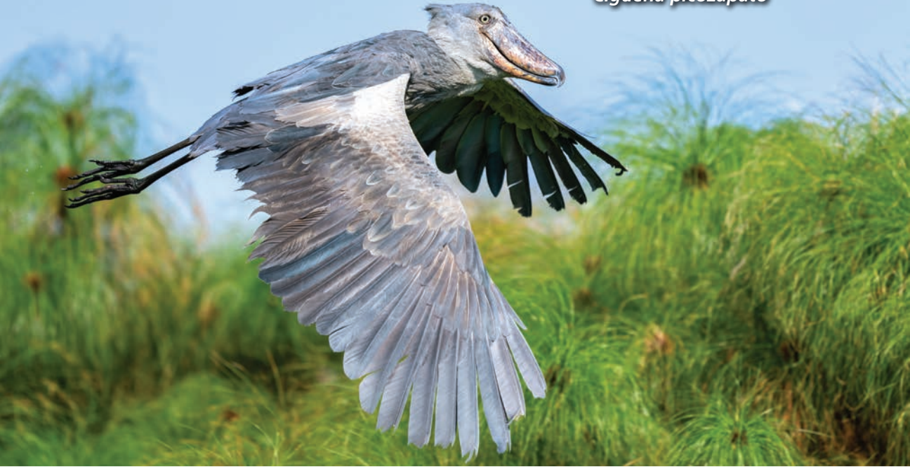
Shoebill stork Cigüeña picozapato

★ The shoebill stork is another modern-day dinosaur. More closely related to pelicans than storks, these huge birds can grow to be as tall as a person and may have an eight-foot wingspan. Despite their size, however, these birds are still able to fly. They are top predators in the swamps of eastern Africa, where they live. Their powerful beaks allow them to sometimes even snack on small crocodiles!