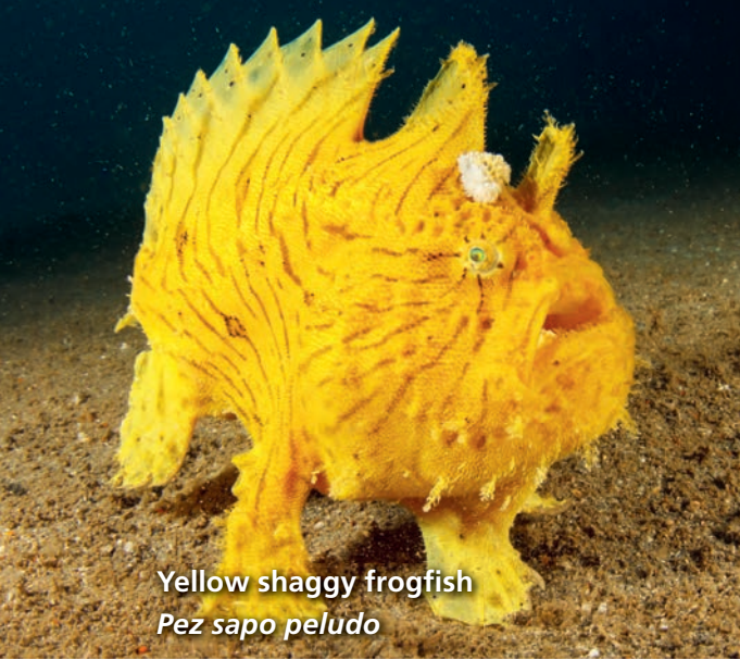
Yellow shaggy frogfish Pez sapo peludo