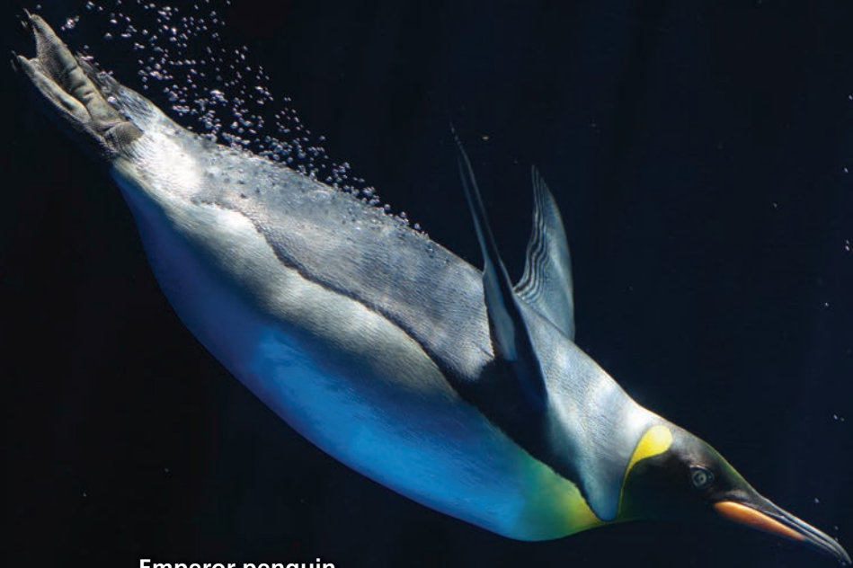
Emperor penguin Pingüino emperador