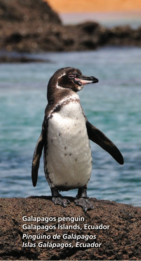
Galapagos penguin Galapagos Islands, Ecuador Pingüino de Galápagos Islas Galápagos, Ecuador