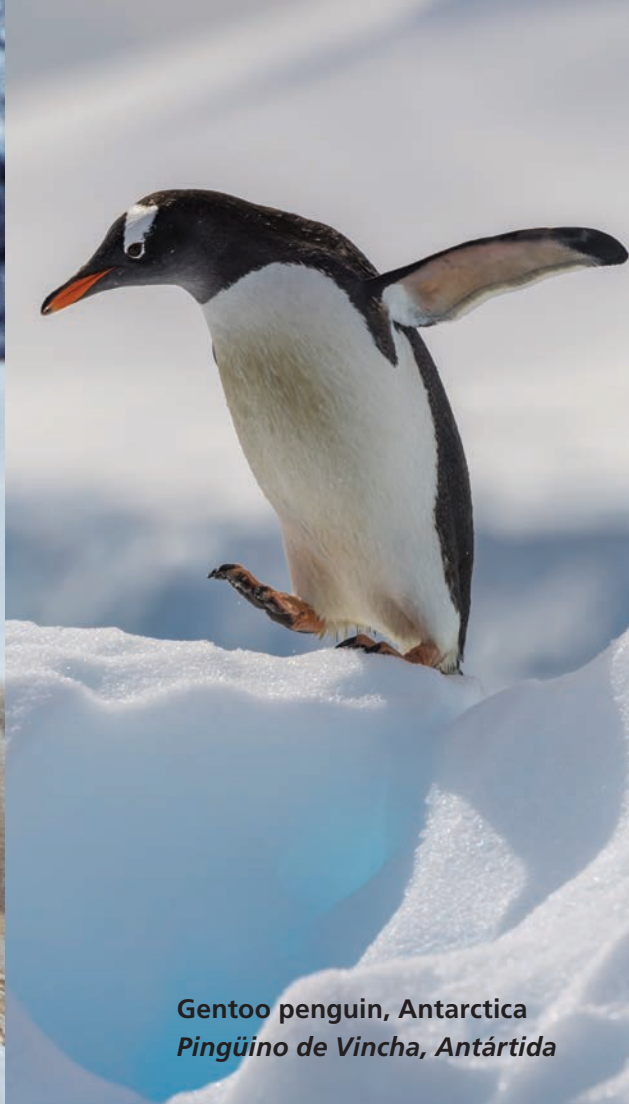
Gentoo penguin, Antarctica Pingüino de Vincha, Antártida