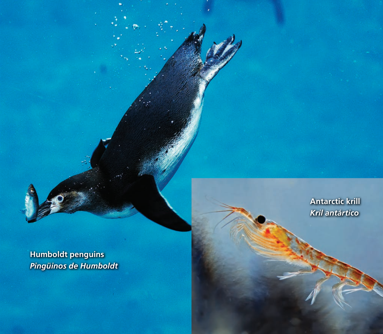
Humboldt penguins Pingüinos de Humboldt