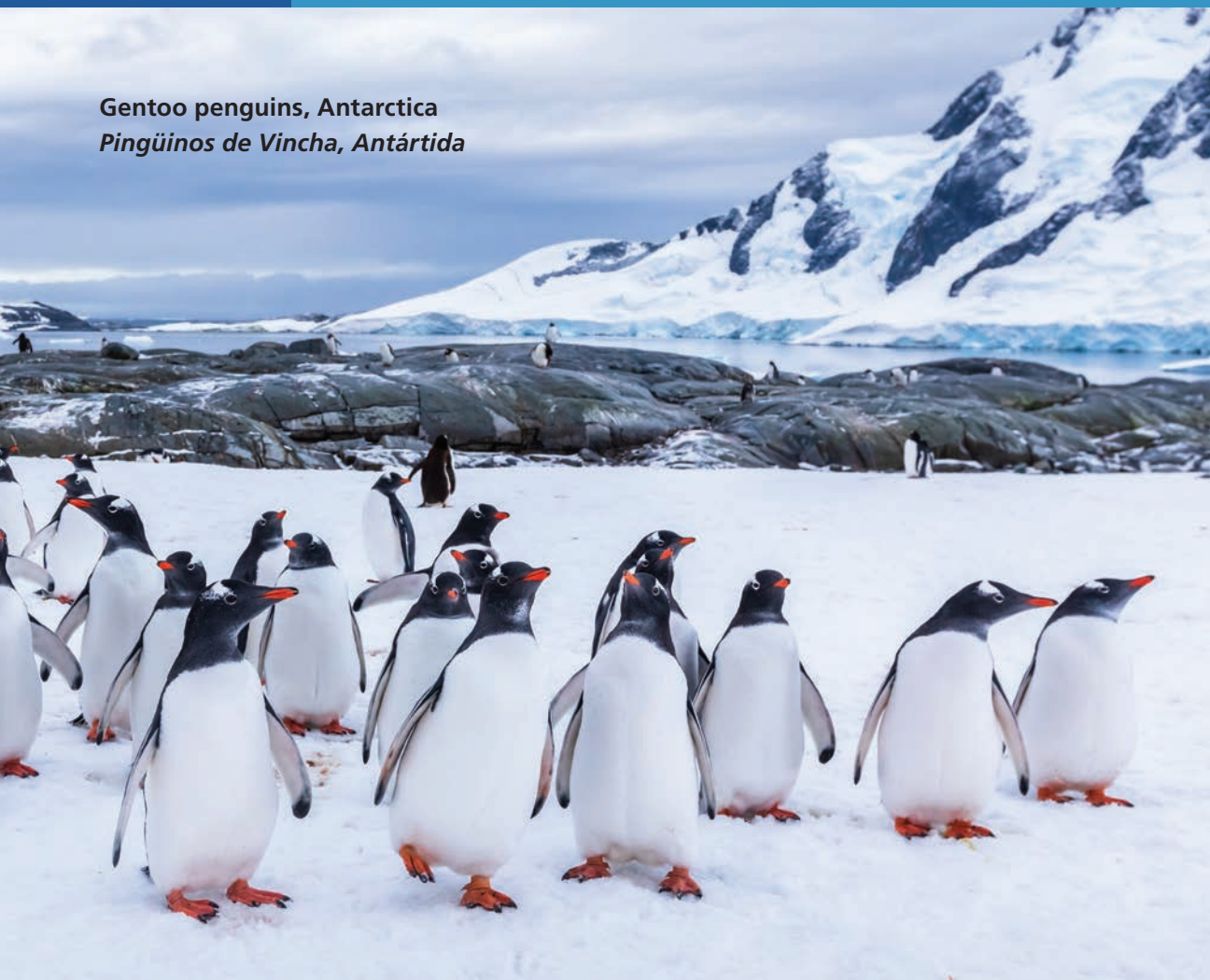
Gentoo penguins, Antarctica Pingüinos de Vincha, Antártida