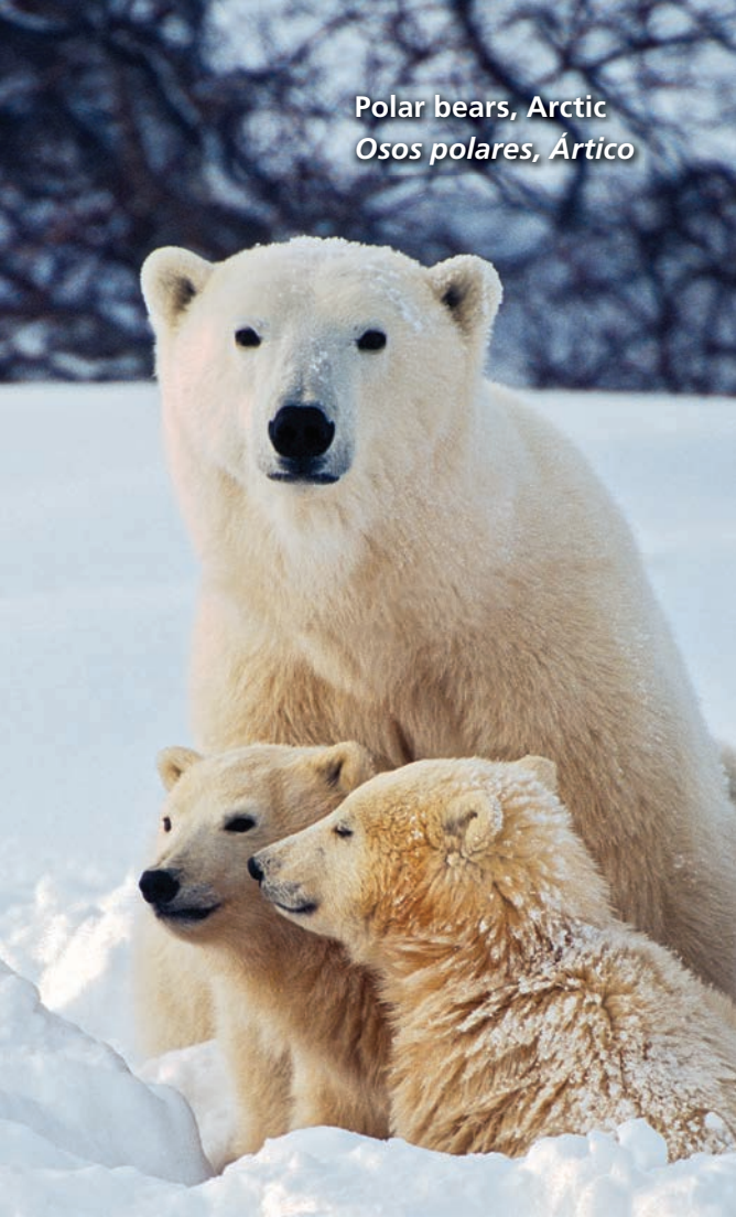
Polar bears, Arctic Osos polares, Ártico