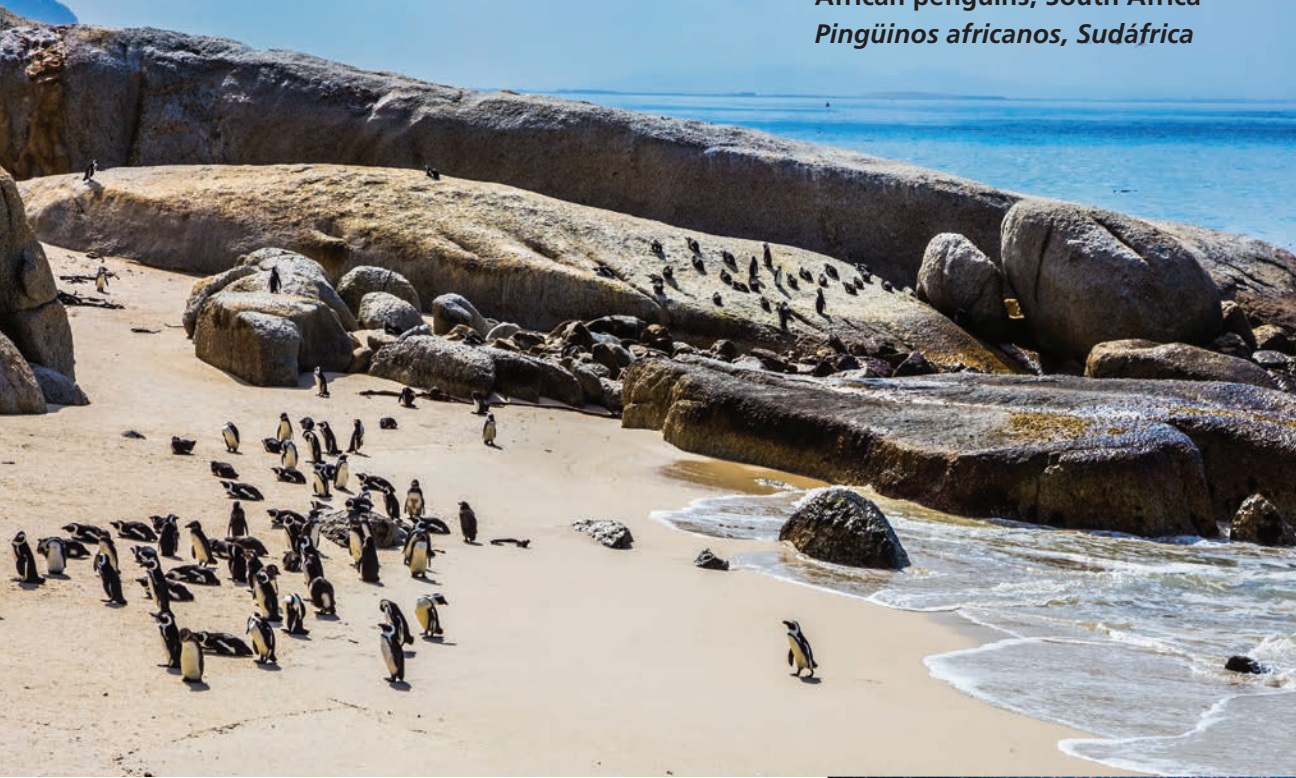
African penguins, South Africa Pingüinos africanos, Sudáfrica

★ Some types of penguins live in much warmer places. These African penguins, for example, live on the sunny beaches of South Africa.