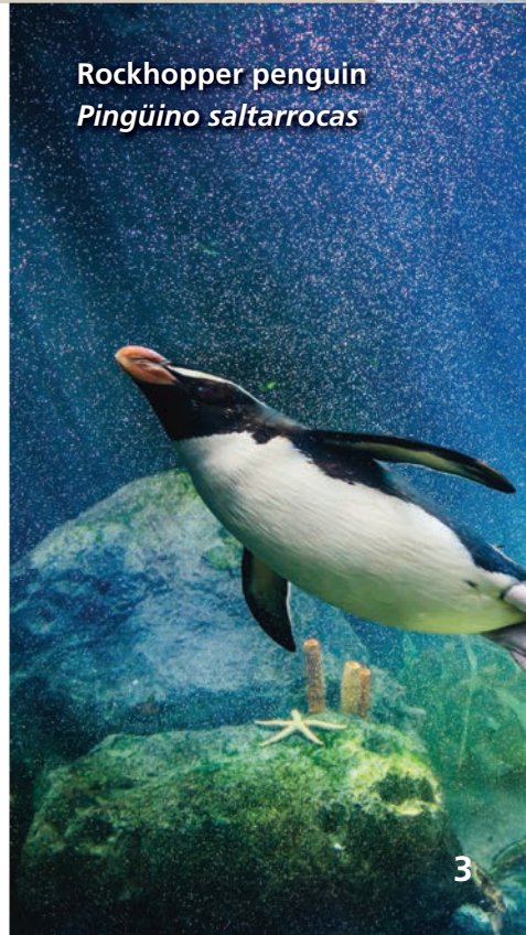
Rockhopper penguin Pingüino saltarrocas